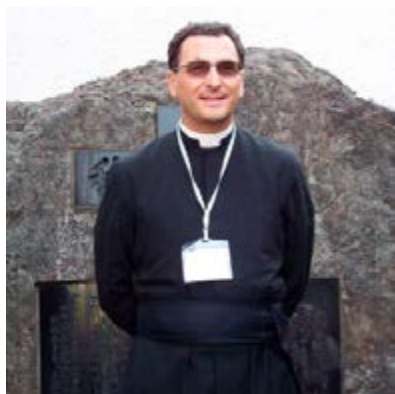
о. Карл Штелин

О. Карл Штелин желает поддерживать и развивать М.И.