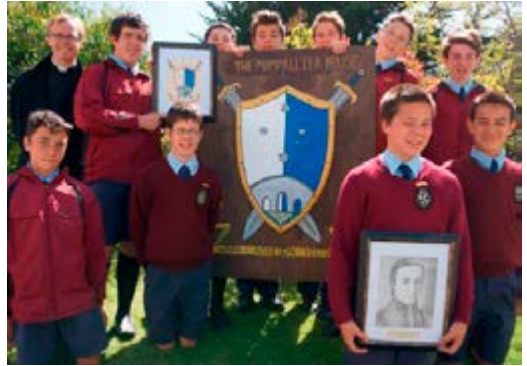
Учащиеся школы св. Августина в Уонгануи