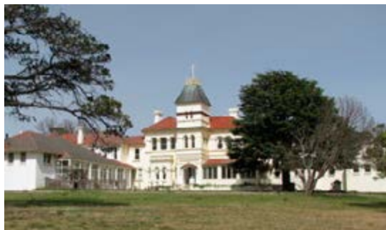
Семинария Святого Креста в Гоулберне

22 августа, в праздник Непорочного Сердца Марии о Штелин принял почти 200 новых рыцарей в школе св. Фомы Аквинского в Тинонге. В тот же день 16 новых рыцарей были приняты в семинарии Святого Креста в Гоулберне.