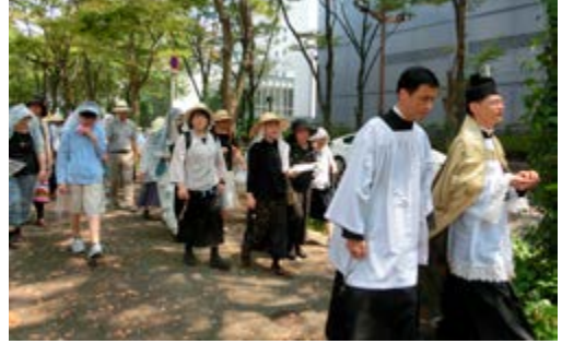
Процессия в честь Пресвятой Девы по кончани

даже наши заслуги. Это лучший путь к нашему спасению и к возданию чести Богу, ибо Господь наш Иисус Христос делал сие именно таким образом. Он жил вместе с Богородицей 30 лет и сказал: «Я подал вам пример... следуйте за Мной». Он любил Свою Матерь во время публичной жизни так же, как и в частной.