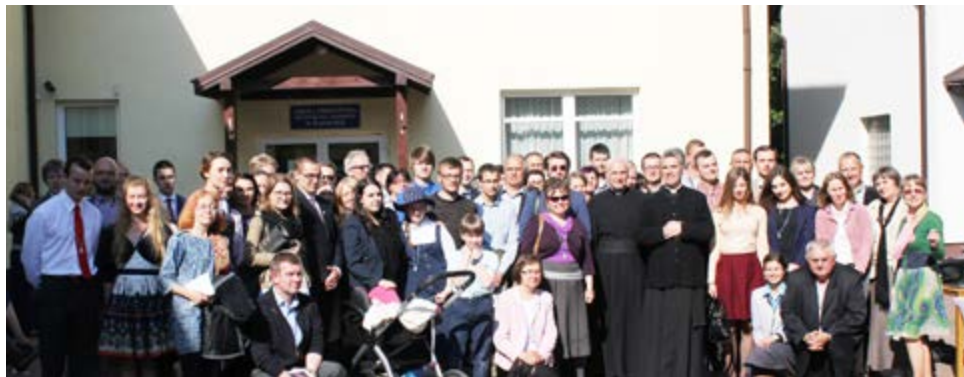
Новые рыцари Польши

Militia Immaculatæ насчитывает более 15 тыс. членов по всему миру: Польша, Франция, Германия, Швейцария, Австрия, Великобритания, Хорватия, США, Япония, Филиппины, Сингапур, Индия, Малайзия, Индонезия, Таиланд и другие страны Азии