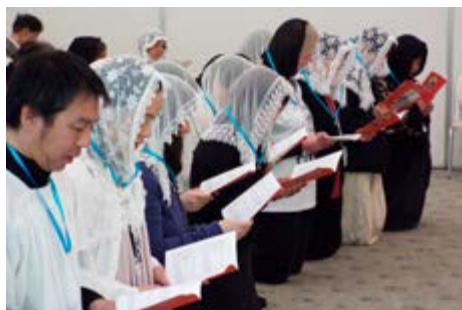
Новые рыцари Японии