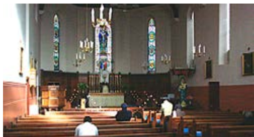
Часовня св. Иосифа и Патерна в Лондоне