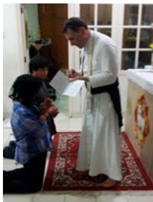
Новые рыцари Индонезии