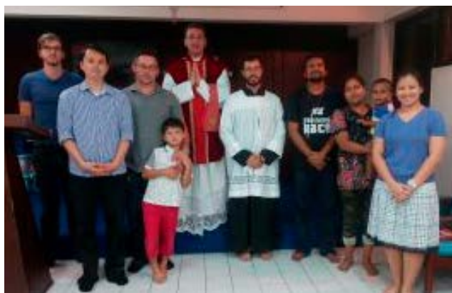
Первые рыцари Таиланда