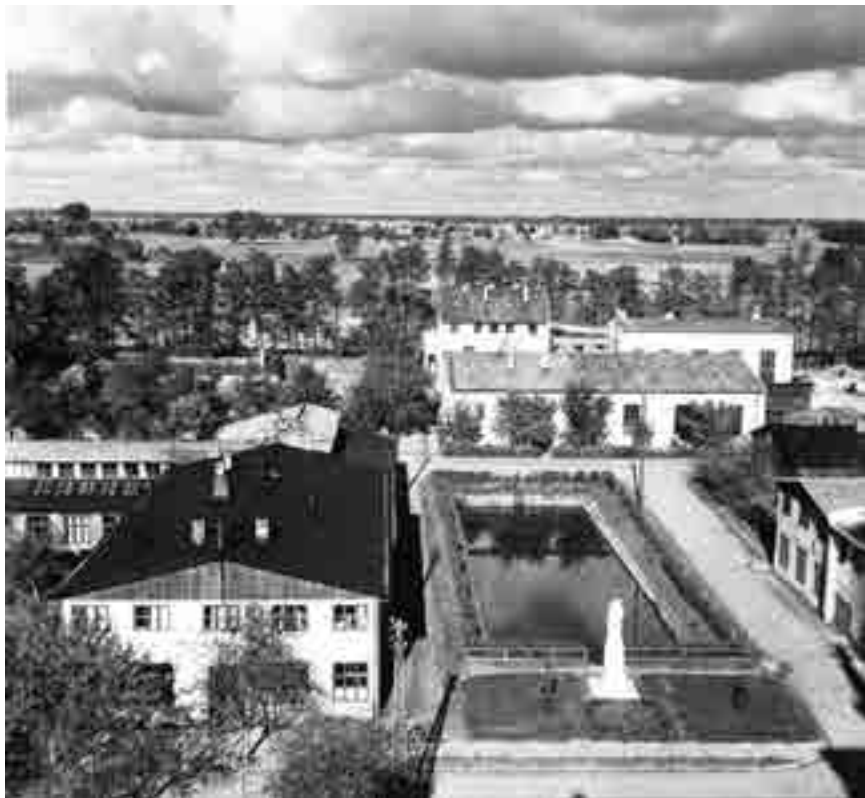
La Ciudad de la Inmaculada (Niepokalanów en Polonia)

Hacemos todo con su ayuda, vivimos y trabajamos bajo su protección.” Se trata del grado de la comunidad religiosa, consagrada por completo a este apostolado de la Inmaculada. “Resumiendo: el primer grado se limita a la acción individual, el segundo añade la acción social, y el tercero, rayando todo límite, tiende al heroísmo” (Carta 25, V, 1920).