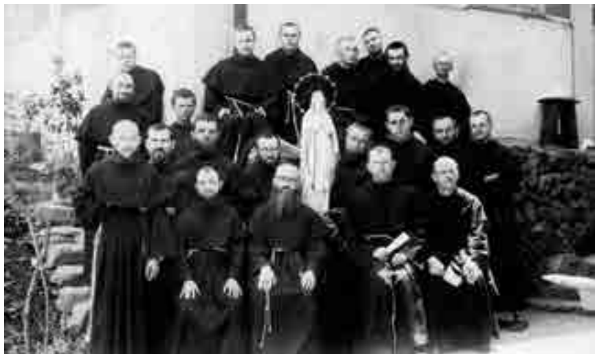
Imprenta de Niepokalanów

En 1939, en vísperas de la Segunda Guerra Mundial, cuenta con la importante cantidad de 762 Hermanos, con una gigantesca prensa (periódicos, revistas mensuales, calendarios, libros, etc., impresos en diversas lenguas). La “ciudad de la Inmaculada” es, en razón de la guerra, severamente afectada. Muchos Hermanos son enviados a diversos campos de concentración.