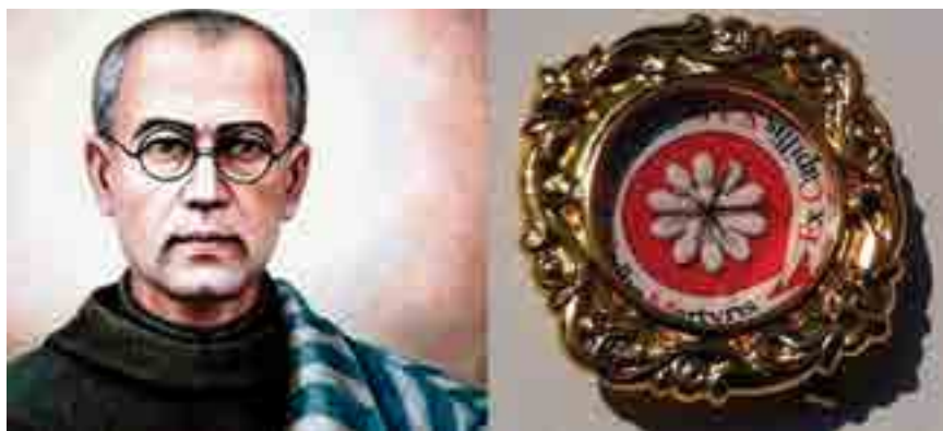
La reliquia de San Maximiliano: unas hebras de cabello

Una gran batalla se libraré bajo el estandarte de la Inmaculada; enarbolaremos sus banderas contra las huestes del príncipe de las tinieblas; entonces, la Inmaculada se convertirá en la Reina del mundo entero y de cada alma en particular... (Carta 3/5/1931)