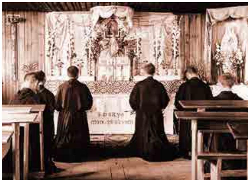
La Ciudad de la Inmaculada (Niepokalanów en Polonia)

con su felicitación y su Bendición Apostólica. En el momento del concilio Vaticano II, la MI contaba con 500 sucursales en los cinco continentes, y aproximadamente 3 millones de miembros.