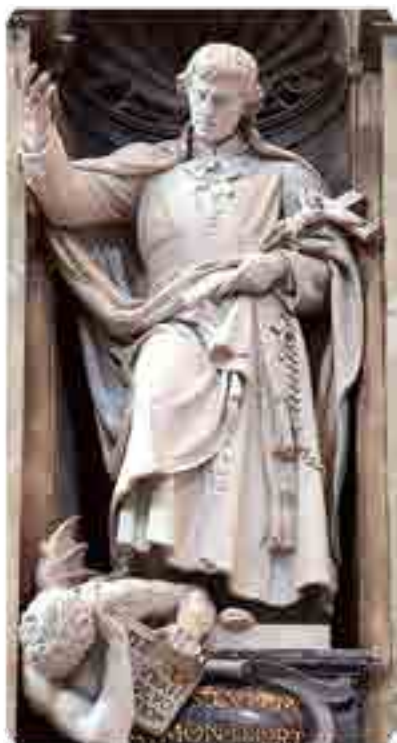
San Luis María Grignon de Montfort, uno de los santos marianos más grandes, cuyos escritos inspiraron particularmente a San Maximiliano

y la Inmaculada?” Gracias a la meditación de las Sagradas Escrituras y de los Padres de la Iglesia; inspirándose en la doctrina de los grandes santos marianos como San Luis María Grignon de Montfort; considerando también el dogma de la Inmaculada Concepción y las apariciones de Nuestra Señora en Lourdes, como también el alcance práctico y social de estas grandes verdades, nuestro Hermano llegó a la siguiente conclusión: “La Virgen sin mancha, vencedora de todas las herejías, no cederá el paso ante su enemigo amenazante si encuentra servidores fieles, dóciles a su mandato, Ella obtendrá nuevas victorias, más grandes de las que podríamos imaginarnos...”