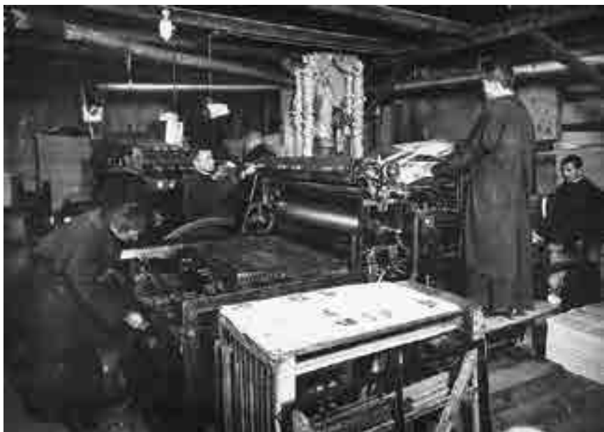
Imprenta de Niepokalanów

En 1922 publica el primer número de la revista “Caballero de la Inmaculada”. Los costos de impresión fueron cubiertos con donativos. De 1922 a 1927 contará con una pequeña imprenta en el monasterio de Grodno. Debido al aumento de vocaciones y al desarrollo del apostolado de la prensa deja Grodno y funda en 1927 Niepokalanów, “la ciudad de la Inmaculada”, de la cual será nombrado por sus superiores Caballero de la Inmaculada (Seibo 1930, desde 1930 a 1936 wirkt na Kishi ) actuando en Japón como misionero