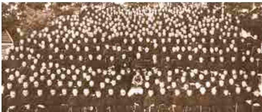
In 1922 waren er slechts 3 broeders. In 1927, wanneer de Stad van de Onbevleete werd opgericht, waren er al 18 broeders en in 1939 waren dat er 762.

Verder kunnen reeds bestaande organisaties (bv. jeugdbewegingen, studiegroepen, enz.) zich ten dienste stellen van de M.I. en zo opereren als M.I.-groepen van de tweede stand.