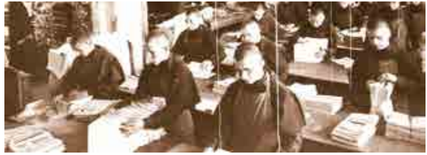
Ridder van de Immaculata (Seibo na Kishi) — Japanse editie.

Illustratie van de titelpagina van het eerste nummer van "Ridder van de Immaculata". In het midden staat de Immaculata die het hoofd van het serpent verplettert, met errond de woorden "Zij zal u de kop verpletteren", en "Gij alleen hebt alle ketterijen ter wereld overwonnen." Bovenaan, in het Pools, staat de titel van de publicatie, Ridder van de Immaculata, tussen twee zuvaarden die de belichamingen van het serpent op aarde bevechten en verslaan. De verslagen vijanden zijn als boeken voorgesteld, wat wil zeggen dat we de dwalingen bestrijden maar houden van de mensen die in dwaling zijn. Deze dwalingen zijn ketterijen en de Vrijmetselarij (waaraan we modernisme en oecumenisme kunnen toevoegen).