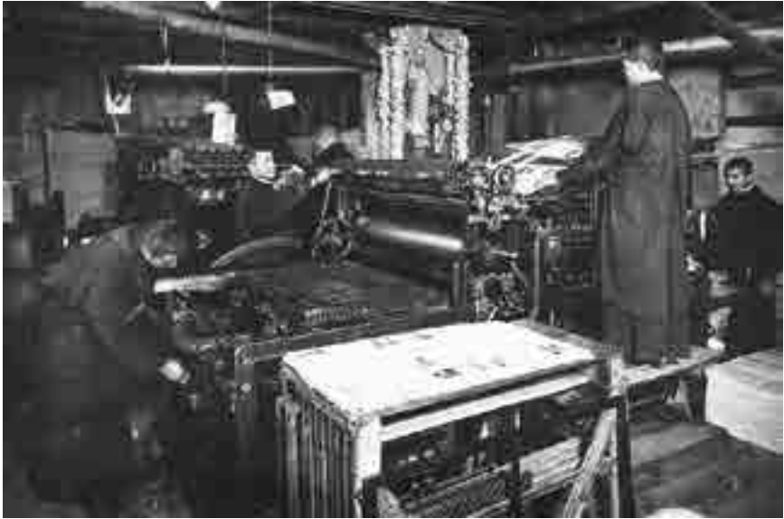
Drukhuis in Niepokalanów.

In 1922 gaf hij het eerste nummer uit van het magazine “Ridders van de Immaculata.” De uitgaven werden bekostigd met het geld dat was gekomen door te bedelen. Van 1922 tot 1927 verbleef Maximiliaan bij zijn kleine drukpers in het klooster van Grodno. Omwille van de toenemende roepingen en de uitbreiding van zijn drukwerkapostolaat, zei hij Grodno vaarwel en stichtte in 1927 Niepokalanów, “de Stad van de Immaculata”, waarvan hij tot 1930 overste was.