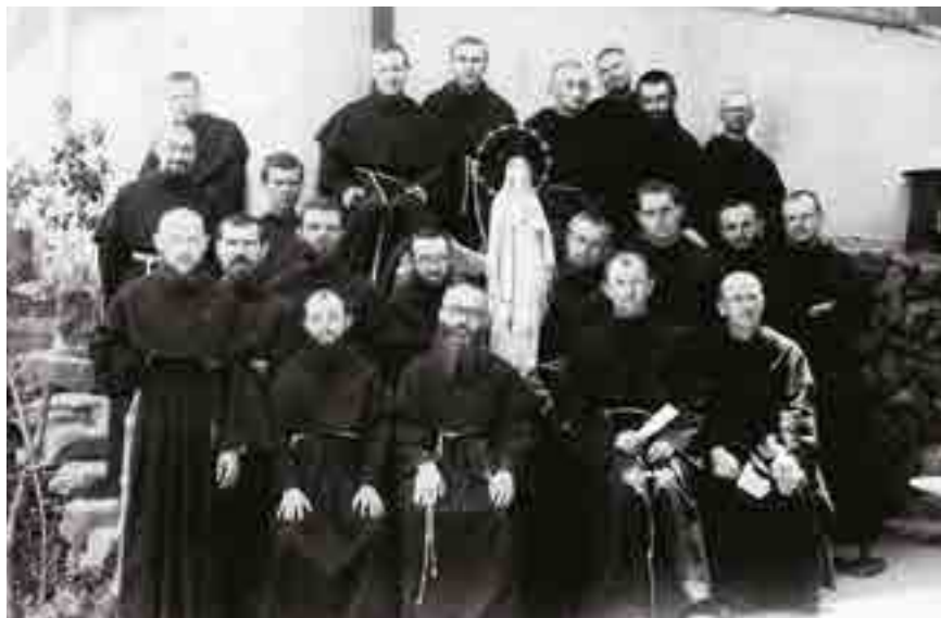
Broeders in Mugenzai no Sono, Japan.

Tegen 1939, op de vooravond van de Tweede Wereldoorlog, telde de religieuze gemeenschap 762 broeders die een enorme drukkerij bedienden waarmee ze dagelijks nieuwsbrieven, kalenders, boeken enz. produceerden in verschillende talen om ze vervolgens te verspreiden.