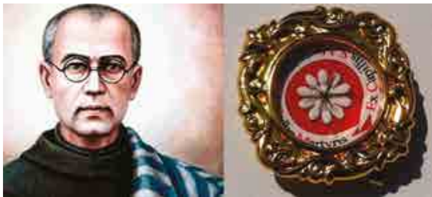
Een relikwie van Sint Maximiliaan: enkele plukken haar

Onder de vlag van de Onbevleete marcheren wij naar het grote gevecht, en wij zullen onze vlaggen opstellen op de bolwerken van de prinsen van de wereld. Dan pas zal de Onbevleete de Koningin van de hele wereld en van ieder individu zijn...” (Brief van 30 mei 1931).