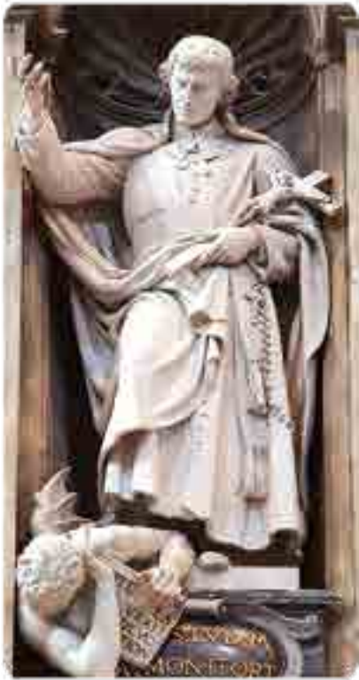
Sint Louis-Marie Grignion de Montfort, een van de grootste Mariale heiligen, wiens geschriften de heilige Maximiliaan bijzonder hebben geïnspireerd

De jonge broeder mediteerde over de Heilige Schrift, de Kerkvaders, de werken van de grote Mariale heiligen, zoals bijvoorbeeld Sint Louis-Marie Grignion de Montfort; hij mediteerde verder ook over het dogma van de Onbevleete Ontvangenis, alsook over de betekenis van de Mariaverschijningen in Lourdes. Deze waarheden en mysteries hebben inderdaad niet alleen een bovennatuurlijke betekenis, ze zijn allemaal ook zeer praktisch vanwege hun sociale relevantie. “De Onbevleete Maagd, de Overwinnares op alle ketterijen, zal niet terugtrekken voor de vijand die zich tegen haar verheft. Als Zij trouwe dienaars vindt die haar gehoorzamen, zal Zij telkens nieuwe overwinningen behalen, groter dan wij ons kunnen voorstellen.”