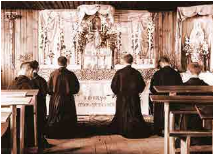
De eerste kapel in Niepokalanów.

Broeder Kolbe richtte in 1930 een tweede “Stad van de Onbevleete” op in Nagasaki, Japan, die op wonderbare wijze gespaard bleef tijdens de atoomaanval van 1945. In de vroege jaren 1960 had de M.I. 500 afdelingen op alle vijf continenten en telde samen meer dan drie miljoen leden.