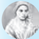
św. Bernadeta Soubirous