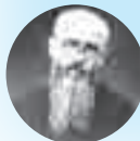
św. Maksymilian Maria Kolbe