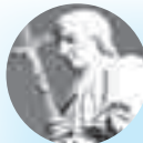
św. Ludwik Maria Grignion de Montfort