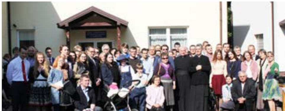
Новые рыцари Польши

Militia Immaculatæ насчитывает более 15 тыс. членов по всему миру: Польша, Франция, Германия, Швейцария, Австрия, Великобритания, Хорватия, США, Япония, Филиппины, Сингапур, Индия, Малайзия, Индонезия, Таиланд и другие страны Азии