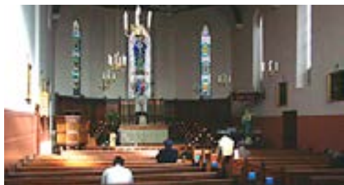
Часовня св. Иосифа и Патерна в Лондоне