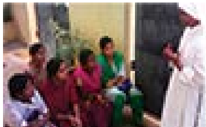
Встреча для девушек

Эти группы очень активны. Члены Молодых рыцарей Непорочной распространили множество буклетов о Богородице Фатим-