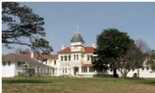
Семинария Святого Креста в Гоулберне

22 августа, в праздник Непорочного Сердца Марии о Штелин принял почти 200 новых рыцарей в школе св. Фомы Аквинского в Тинонге. В тот же день 16 новых рыцарей были приняты в семинарии Святого Креста в Гоулберне.