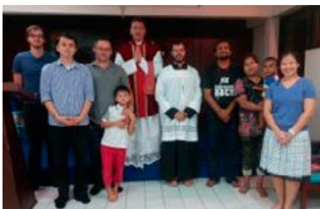
Первые рыцари Таиланда