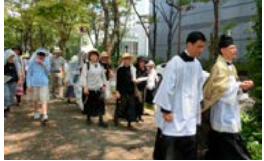
Процессия в честь Пресвятой Девы по кончани

даже наши заслуги. Это лучший путь к нашему спасению и к возданию чести Богу, ибо Господь наш Иисус Христос делал сие именно таким образом. Он жил вместе с Богородицей 30 лет и сказал: «Я подал вам пример... следуйте за Мной». Он любил Свою Матерь во время публичной жизни так же, как и в частной.