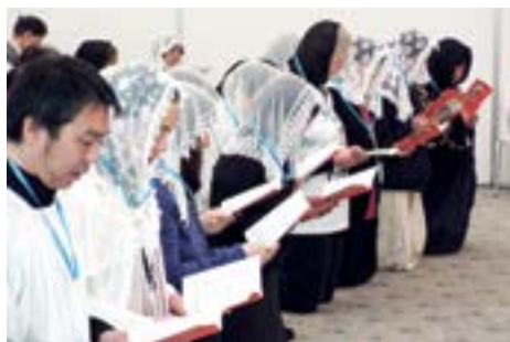
Новые рыцари Япония