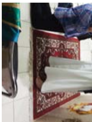
Новые рыцари Индонезии