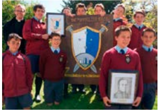
Учащиеся школы св. Августина в Уонгануи