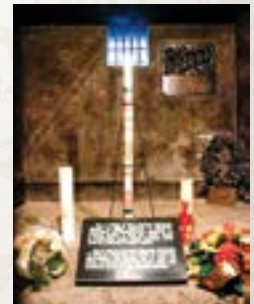
Il bunker della fame, in cui morì San Massimiliano

Il processo di beatificazione finì in aprile 1969 con il Decreto sull'eroicità delle virtù. Fu beatificato nel 1971 e canonizzato nel 1984.