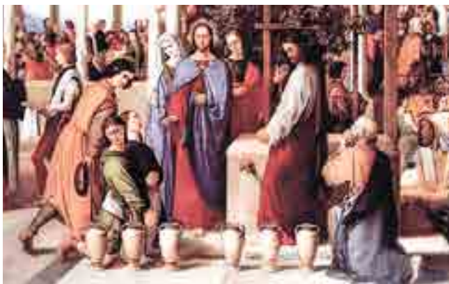
Premier miracle du Sacré-Cœur dans le foyer chrétien, par l'intermédiaire de Marie

Notre-Seigneur est venu au monde par l'intermédiaire de Marie et a commencé sa vie publique par Elle. « Faites ce qu'Il vous dira », dit Marie aux serviteurs. Ils obéirent, et le Christ commença sa vie publique par son premier miracle.