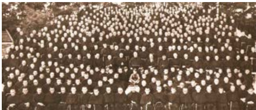
У 1922 р. св. Максиміліан мав двох співпрацівників. У 1927 р., коли постало Місто Непорочної, було 18 братів; а в 1939 р. — 762

3. «Третій ступінь полягає в необмеженому набоженстві до Непорочної, тому Вона може вчинити з нами, що хоче і як хоче. Ми належимо цілковито до Неї, а Вона цілковито належить до нас. Ми робимо все з Її поміччю, живемо й працюємо під Її опікою».