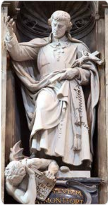
Св. Людовік Марія Грінйон де Монфор, один з найбільших марійних святих, твори якого особливо надихали св. Максиміліана

набагато сильнішої зброї; невже не можемо розраховувати на ціле небо, а особливо на Непорочну?»