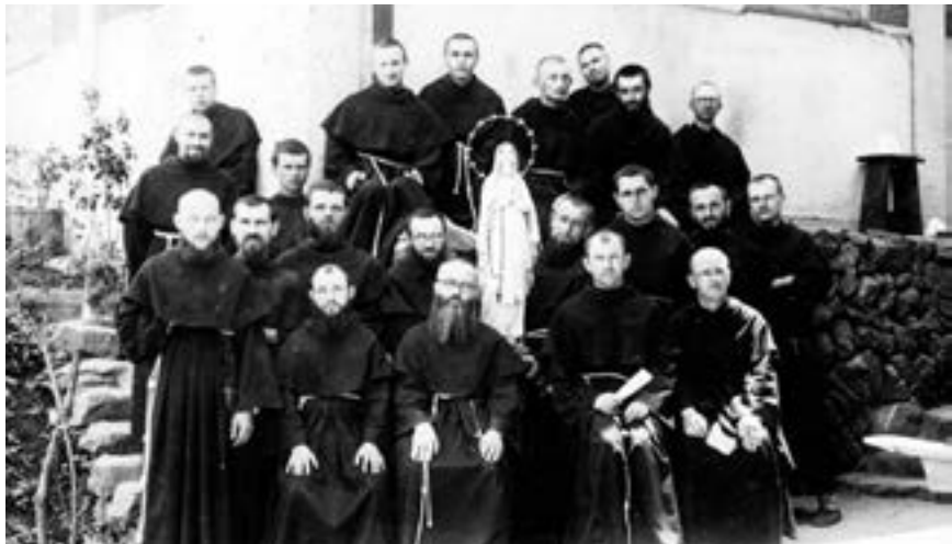
В Mugenzai no Sono в Японії

року, в переддень II Світової війни, релігійна спільнота нараховувала 762 братів, які працювали в гігантському видавництві, що друкувало щоденно газету, місячник, календар, книжки і т. п. різними мовами.