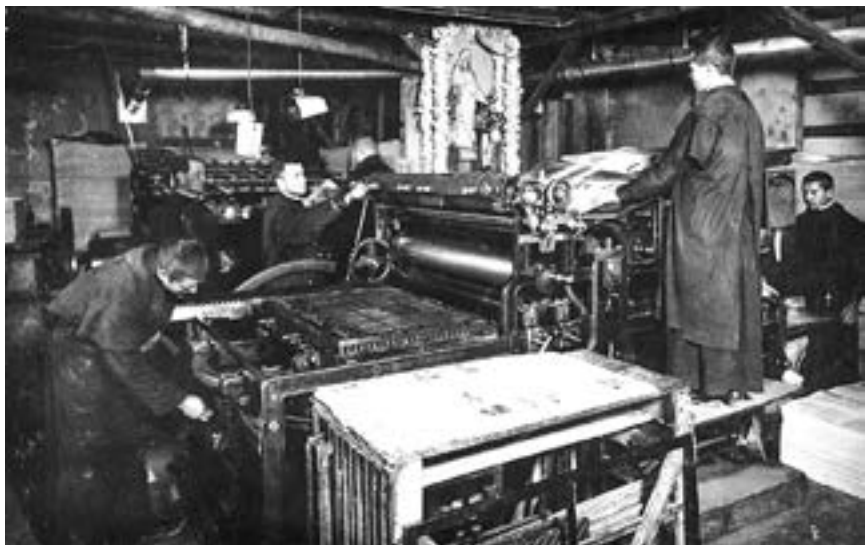
Друкарня в Місті Непорочної

У 1922 році він випустив перший номер часопису під назвою «Лицар Непорочної». Витрати покривалися коштами, зібраними жебракуванням. З 1922 по 1927 рік він влаштувався зі своєю маленькою друкарнею в монастирі в Гродно. Через велику кількість покликань і розширення свого апостольства преси він залишив Гродно і в 1927 році заснував Непокалянв, «Місто Непорочної», настоятелем якого був до 1930 року.