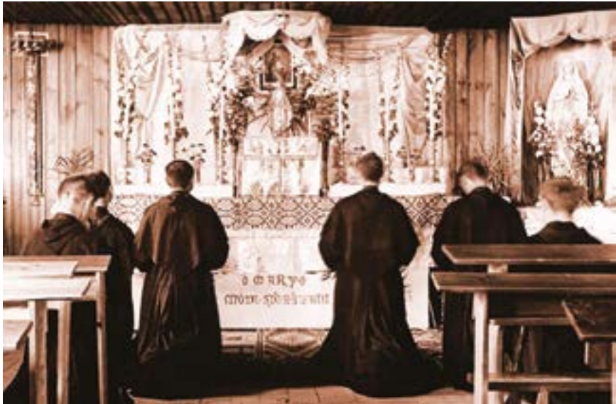
Перша каплиця в Місті Непорочної

У 1930 р. св. Максиміліан засновує друге «Місто Непорочної» в Нагасакі (Японія), яке було в чудесний спосіб захоронене під час бомбардування в 1945 р. На початку 60-х років ХХ ст. Лицарство Непорочної мало 500 філій на всіх п'яти континентах і нараховувало понад 3 мільйони членів.