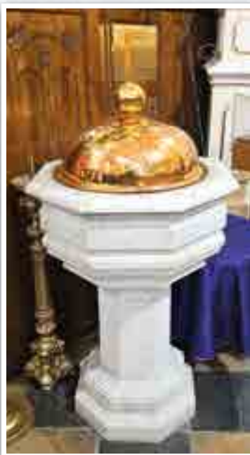
Miejsce urodzenia o. Ma- ksymiliana w domu ro- dzinnym oraz chrzcielni- ca w pobliskim kościele, przy której przyszły świę- ty został ochrzczony.