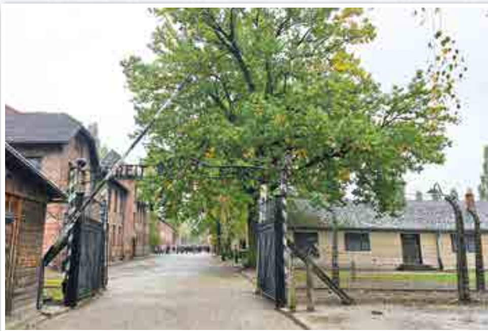
Główna brama wejściowa do obozu Auschwitz.