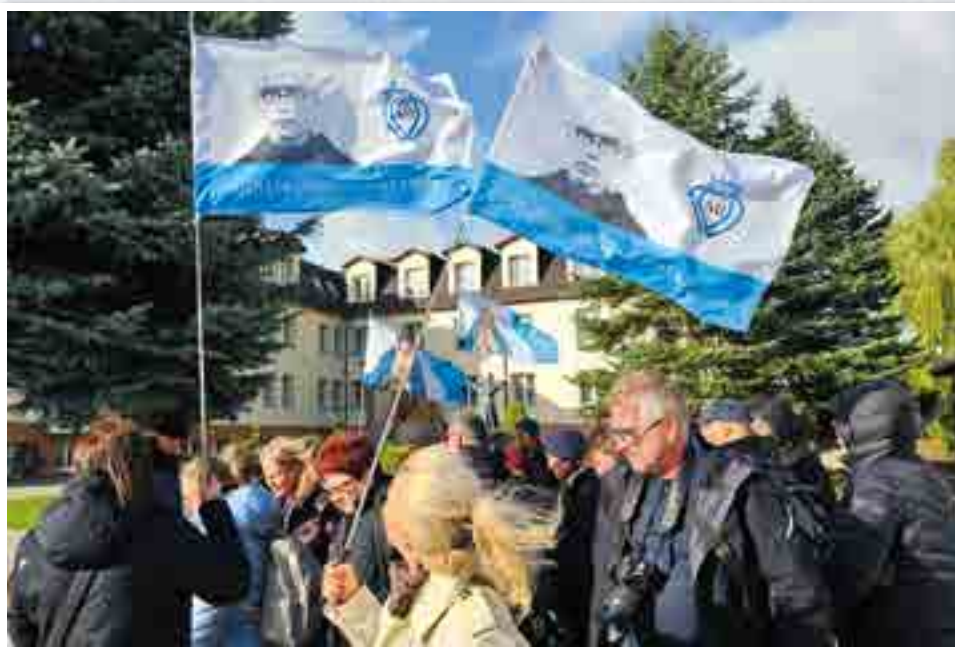
Rycerze w Niepokalanowie.