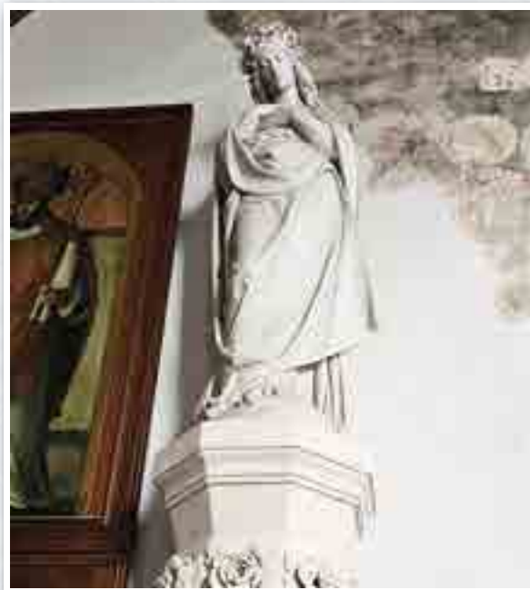
Figura Matki Bożej na krążgankach franciszkańskiego klasztoru oraz jeden z bocznych ołtarzy w bazylice.