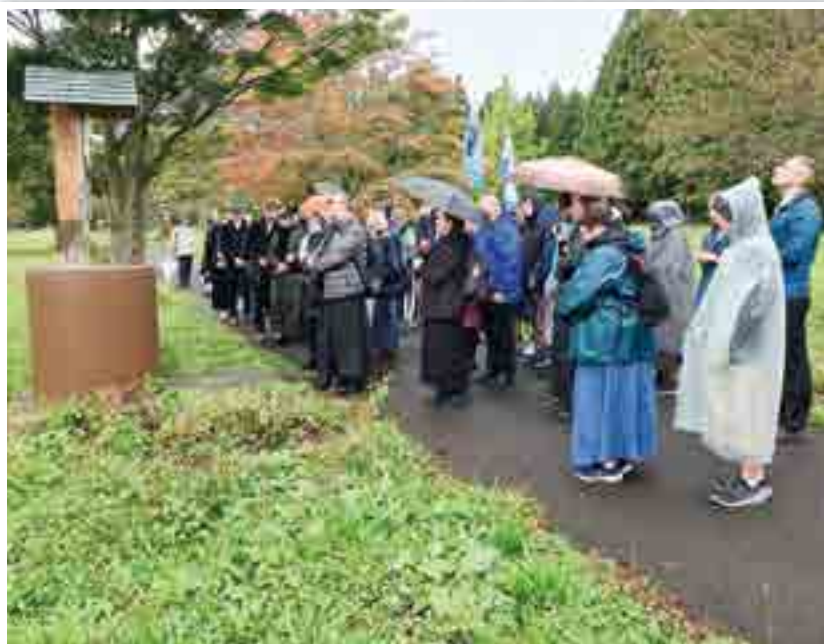
Poniżej droga krzyżowa w Ogrodzie Maryi.