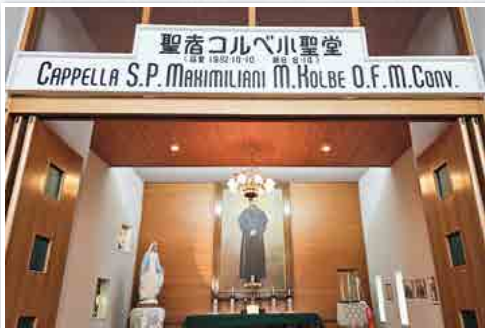
Kaplica o. Maksymiliana w kościele na terenie japońskiego Niepokalanowa.