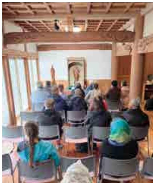
Figura Matki Bożej w Akita.