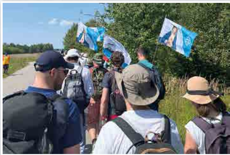
Pielgrzymka na Jasną Górę