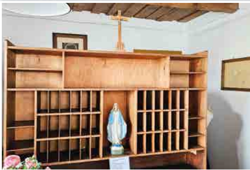
Cela o. Maksymiliana Kolbego w Niepokalanowie.

Do tej celi w dniu 17 lutego 1941 roku weszli niemieccy żołnierze, którzy aresztowali świętego.