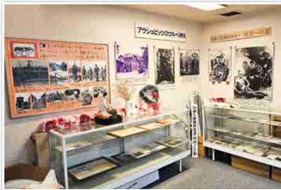
Wystawa wewnątrz domu, przedstawiająca biografię o Maksymilianie.