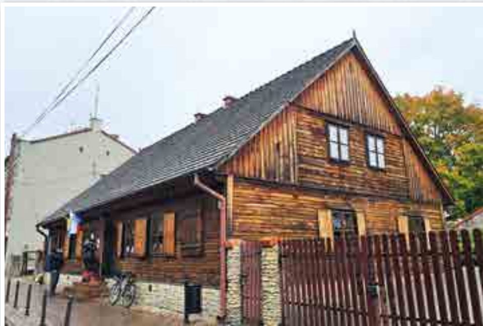
Dom rodzinny o. Maksymiliana Kolbego w Zdunów- skiej Woli.