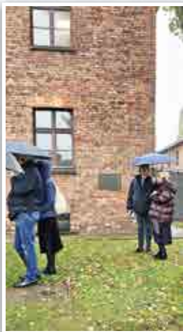
Tablica pamiątkowa na jednym z budynków obozu Auschwitz informująca, iż w tym miejscu podczas apelu wystąpił z szeregu o. Maksymilian Maria Kolbe.