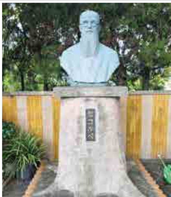
Relikwiarz z włosem z brody o. Maksymiliana oraz jego popiersie w ogrodzie japońskiego Niepokalanowa.